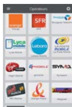
Vente de recharges

Proposer des services additionnels à ses clients